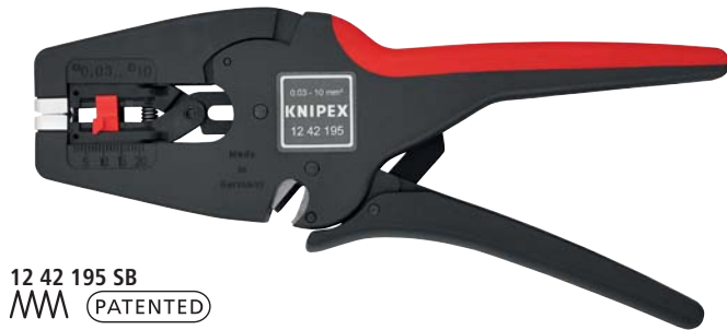
12 42 195 SB MM (PATENTED)