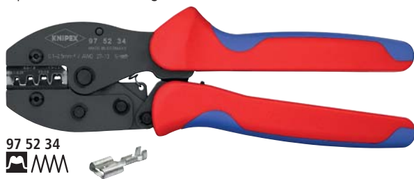
97 52 34 MM