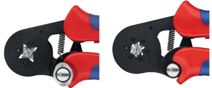
97 53 04 MM (PAT. PEND.)

Particulièrement adapté pour tous les embouts de câble jumelés jusqu'à 2 x 6 mm 2 ou 2 x AWG 8 0,08 - 10 mm 2 + 16 mm 2