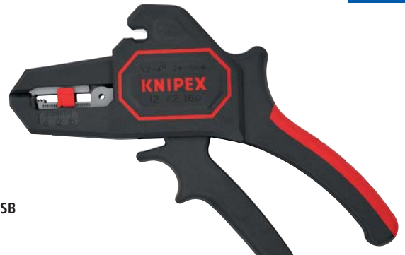
12 62 180 SB MM