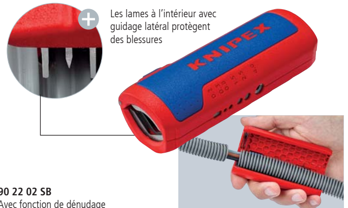
90 22 02 SB Avec fonction de dénudage