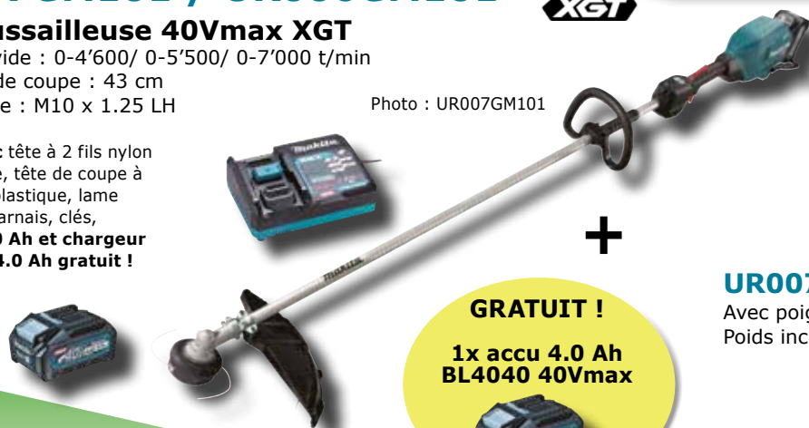
Photo : UR007GM101

Livrée avec tête à 2 fils nylon automatique, tête de coupe à 3 dents en plastique, lame à 2 dents, harnais, clés, 1x accu 4.0 Ah et chargeur + 1x accu 4.0 Ah gratuit !