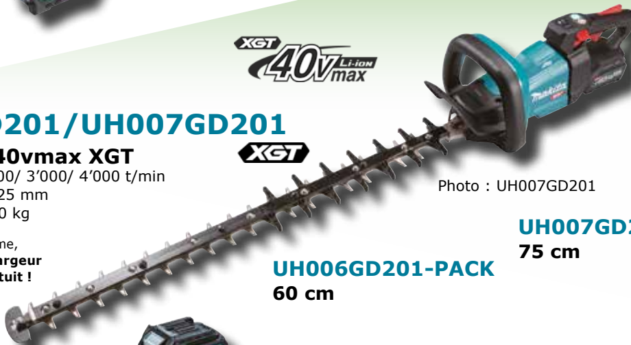
Photo : UH007GD201