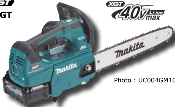
Photo : UC004GM101

*Uniquement pour professionnels ayant suivi une formation spécifique