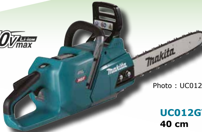
Photo : UC012GT101