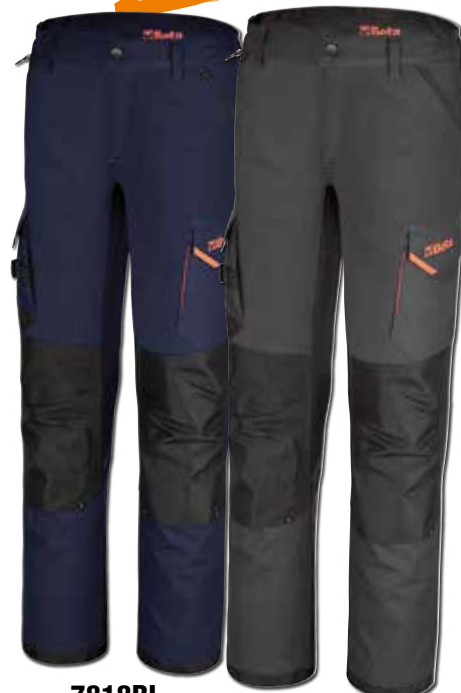
7818BL BLEU PETROLE